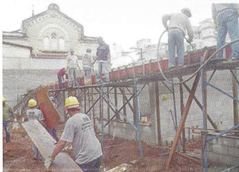
Toda obra está sujeita ao recolhimento e registro de ART

O que é ART? A ART – Anotação de Responsabilidade Técnica é o instrumento instituído pela Lei nº 6.496, de 07 de dezembro de 1977, e regulamentada pela Resolução nº 425, de 1998, com o objetivo de definir, para os efeitos legais, a autoria e os limites da responsabilidade técnica pela execução de obra ou prestação de qualquer serviço de Engenharia, Arquitetura, Agronomia, Geologia, Geografia, Meteorologia, valorizando o exercício profissional. As ARTs do profissional registradas pelo Crea compõem seu acervo técnico.