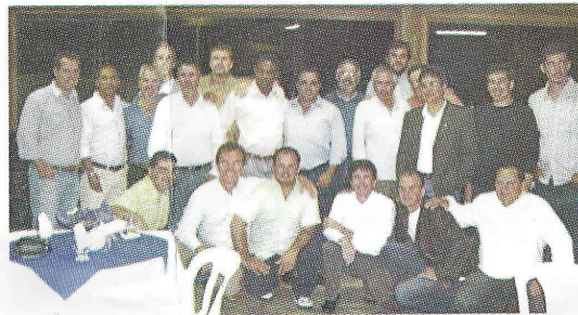
Diretores da Aresp