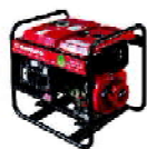
Geradores de Energia