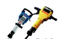
Martelos Demolidores 16/30kg