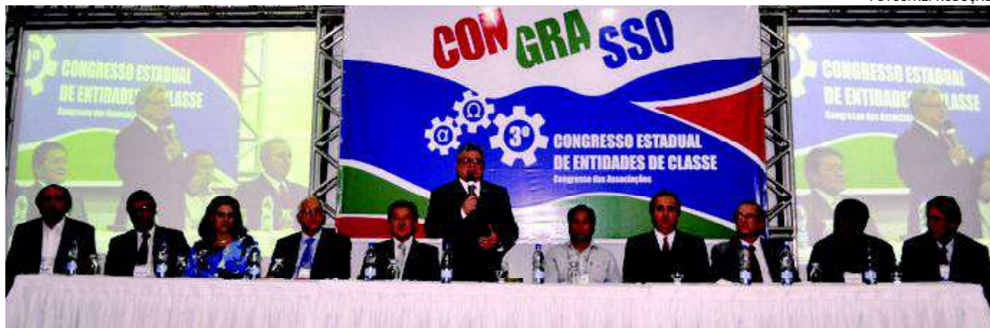
Equipe. A composição da mesa diretora do Terceiro Congresso realizado em Águas de Lindoia