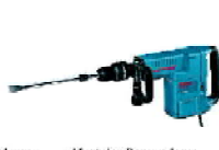
Martelos Rompedores e Perfuradores