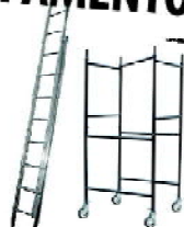
Escadas e Andaimés