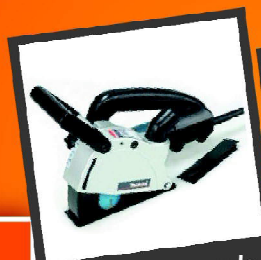
Cortador de parede