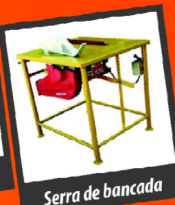
Serra de bancada