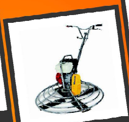
Alisador de concreto